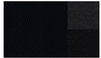
Тканевая обивка сидений Peugeot CRAN BLEU (44FY)