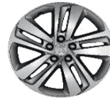
Литые алюминиевые диски* PHOENIX