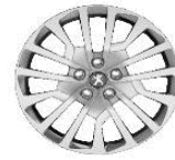
Колпаки штампованных стальных