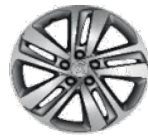
Литые алюминиевые диски 17" PHOENIX