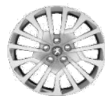
Колпаки штампованных стальных дисков 17" MIAMI