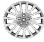
Колпаки штампованных стальных дисков 17" MIAMI