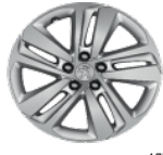
Литые алюминиевые диски 17" PHOENIX