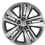
Литые алюминиевые диски 17" CURVE